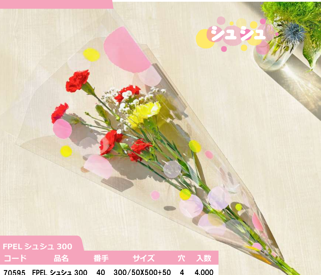
表 シュシュ柄 裏 透明