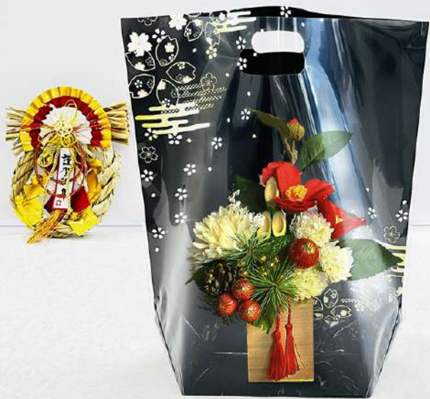
クイックギフトバック L 彩華 黒