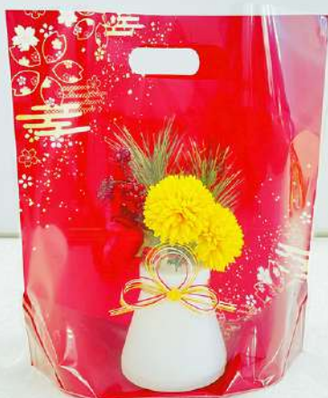
クイックギフトバック S みやび 赤

コード:72733 品名:L 彩華 赤 番手:OP30/CP30 サイズ: 400*420 (90GZ) 穴:0 入数:5.00