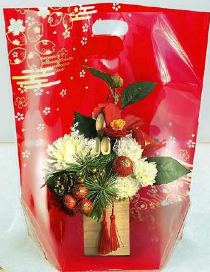
クイックギフトバック L 彩華 赤

コード:72734 品名:L 彩華 黒 番手:OP30/CP30 サイズ: 400*420 (90GZ) 穴:0 入数:5.00